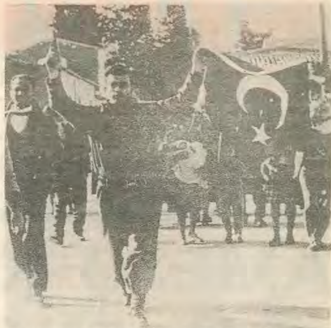
Ο «Τουρκοφάγος» Σαμψών πανηγυρίζει τη νίκη του μετά από την επίθεση και τις σφαγές αμάχων στην Ομορφίτα.

Και όμως τα ερωτήματα της ιστορίας προβάλλουν αμείλιχα. Κάθε συνειδητός νεολαίος μαχητής του σοσιαλισμού -κομμουνισμού πρέπει ν' απαντήσει σταράτα. Όταν η Ε.Φ. σκότωνε, βίαζε και λεηλατούσε τουρκοκυπριακούς πληθυσμούς, όταν ξεσπίτωνε 60.000 τουρκοκυπρίους και τους εξανάγκαζε με την βία και την τρομοκρατία να αναζητήσουν καταφύγιο στον Τ/Κ τμήμα της Λευκωσίας και στην λωρίδα γης προς την Κερύνεια όπου βρισκόταν η